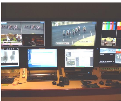
Le poste de travail pour la valorisation des archives