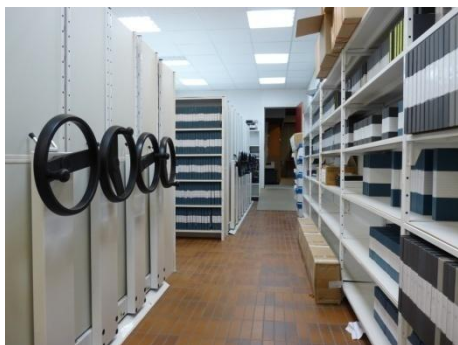
La salle des archives

La solution Active Circle est présentée par EVS car compatible avec les serveurs de diffusion et surtout avec le logiciel IP Director qui référence les contenus. Dans ce contexte, après étude des offres du marché, la solution proposée par les sociétés EVS et Active Circle est sélectionnée. L'intégration est réalisée par la société AV2P qui distribue les solutions Active Circle. « Nous avons choisi Active Circle pour sa simplicité d'utilisation, la transparence d'accès en mode fichier, et son format non propriétaire TAR sur bande qui garantit une ouverture maximale aux standards » souligne Michel Harnie, responsable technique et chef de projet.