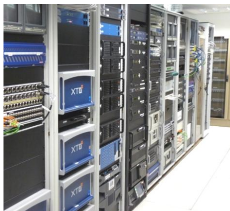
Le Système Active Circle occupe 8 U dans un rack

Pour Thierry Bastian, directeur technique, « La mise en production de notre nouveau système d'archivage est un succès. Nous avons sécurisé nos contenus, nous y accédons plus rapidement et nous pouvons mieux les valoriser. Le stockage et l'archivage du contenu sont maintenant HD, ce qui représente une étape de plus vers le passage au 100% HD, que nous réalisons de manière progressive pour des raisons budgétaires ».